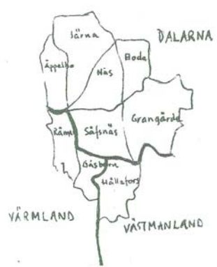
Nås och Söfnsås med angränsande socknar. Karta: Annika Skansens.